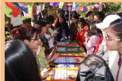
Feria de lengua extranjera (Inglés) en el plantel.