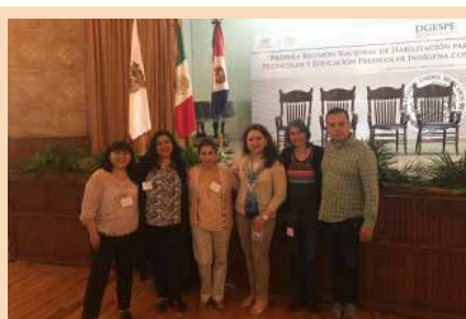
Acervo ENMJN, Formadores de docentes en curso de actualización para el Plan 2018. San Luis Potosí. SJP.