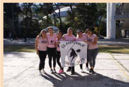
Actividades relacionadas con la promoción y el fomento a la cultura dentro de la ENMJN.