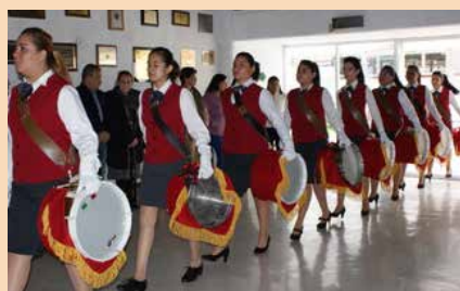
Escolta de la ENMJN que participa en las conmemoraciones de la institución.