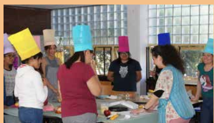
Acervo ENMJN, Cursos Optativos que acercan a las estudiantes a experiencias formativas teórico-prácticas.