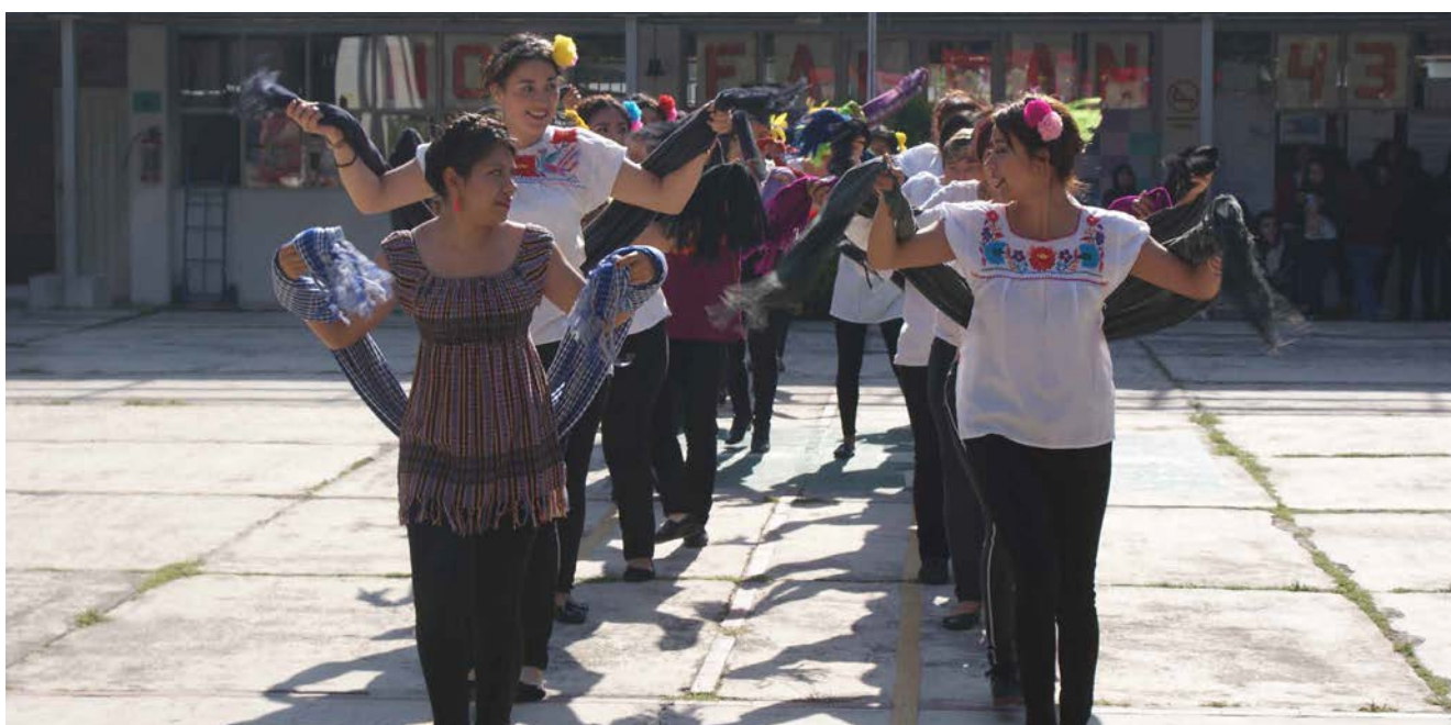
Docentes y estudiantes del Posgrado en Competencias Docentes.

Escuela Nacional para Maestras de Jardines de Niños (ENMJN)